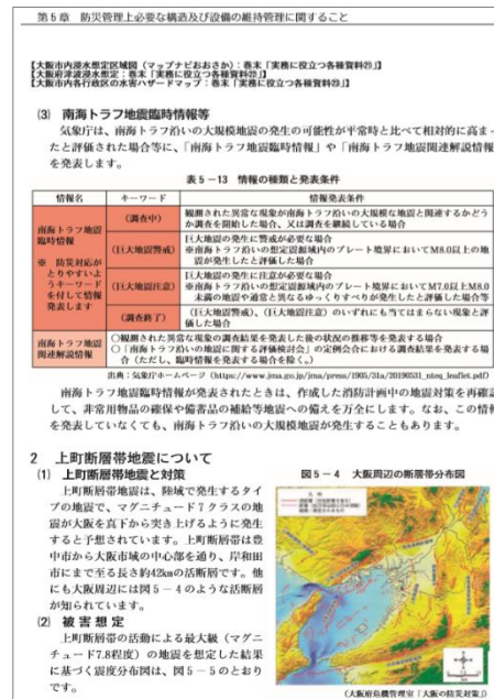
(「第5章 防災管理上必要な構造及び設備の維持管理に関すること」から)